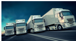
Transport und Logistik