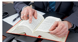
Compliance und Strafrecht