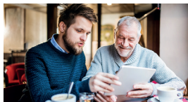
Familie und Vererben