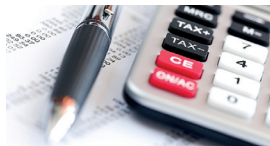
Steuern und Abgaben