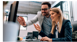
Arbeit und Personal