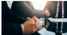
Stiftung und Vereine