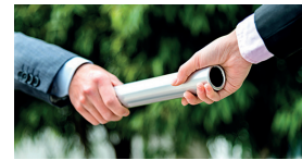
Unternehmens- und Vermögensnachfolge