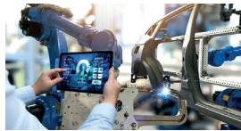
Unternehmen und Wirtschaft

Wir bieten optimale Lösungen in allen unternehmerischen Rechtsfragen, besitzen aber besondere Expertise in den Kompetenzfeldern