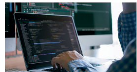
IT und Datenschutz