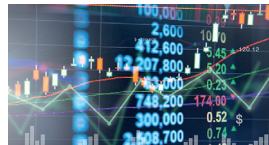
Banken und Kapitalmarkt