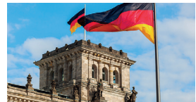
Staat und Verwaltung