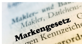
Marken und Wettbewerb