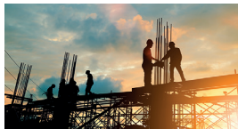
Immobilien und Bauen