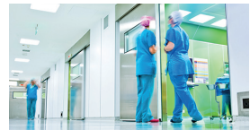
Medizin und Heilberufe